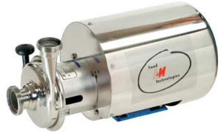
Pompy wirowe "PLC" Sanitary centrifugal pump "PLC"