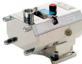
Pompy krzywkowe dwuwirnikowe "TCL" & "HCL" Lobe pump "TCL" & "HCL"