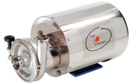
Pompy wirowe "ES" Centrifugal pump "ES"