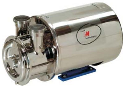
Samozasysające pompy wirowe "ASP" & "ASPZ" Self-priming pumps "ASP" & "ASPZ"

Pumps and systems for the Food, Dairy, Beverage and Pharmaceutical Industry