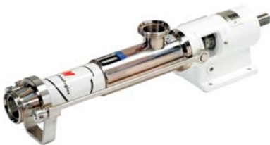
Pompy ślimakowe "LMHS-CIP" Eccentric screw pump "LMHS-CIP"