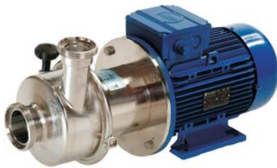
Pompy wirowe "HGX" Centrifugal pump "HGX"